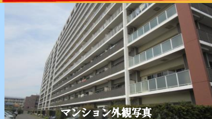
マンション外観写真