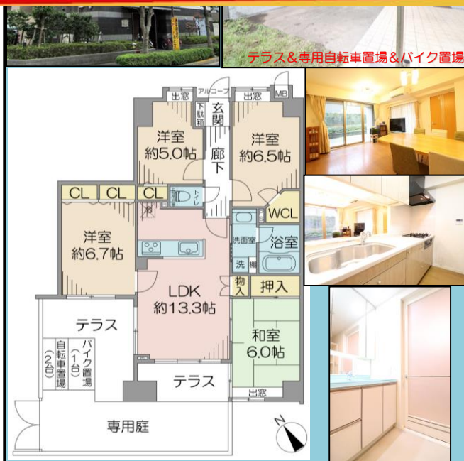
テラス&専用自転車置場&バイク置場