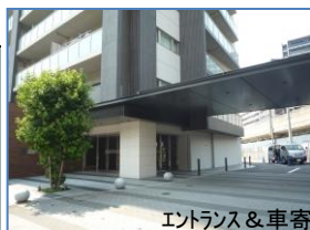
エントランス&車寄