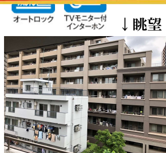
オートロック TVモニター付インターホン ↓眺望