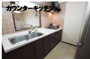
カウンターキッチン