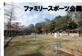
ファミリースポーツ公園