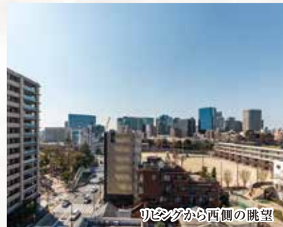
リビングから西側の眺望