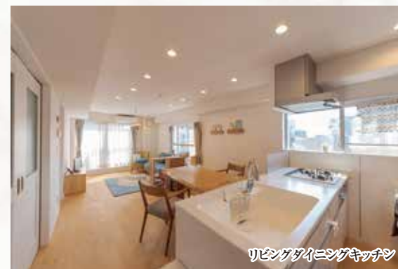
リビングダイニングキッチン