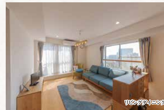
リビングダイニング