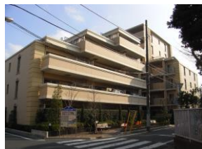
外観 平成16年8月建築