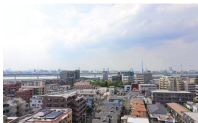
前面に高い建物がなく開放的な眺望 (晴れた日にはスカイツリー & 富士山が鑑賞できます)