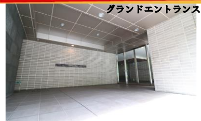
グランドエントランス

4095.72 m 2 分: 7411 / 1016021 域 ( 第一種住居地域 ) 積 ( 壁芯 ) 74.11 m 2 ( 22.41 坪 ) 二 11.34 m 2 ( 3.43 坪 )