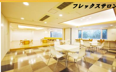
フレックスサロン