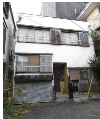
現地写真(2019年12月撮影)