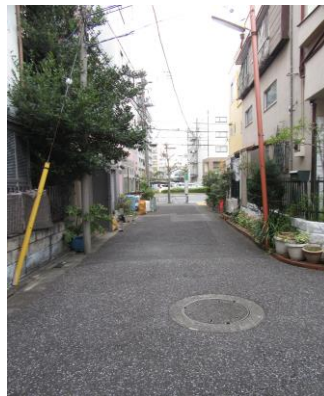
前面道路写真(2019年12月撮影)