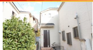
【外観 西側より撮影】