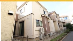
【外観 東側より撮影】