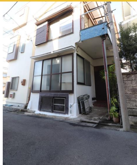
現地写真(2020年1月撮影)