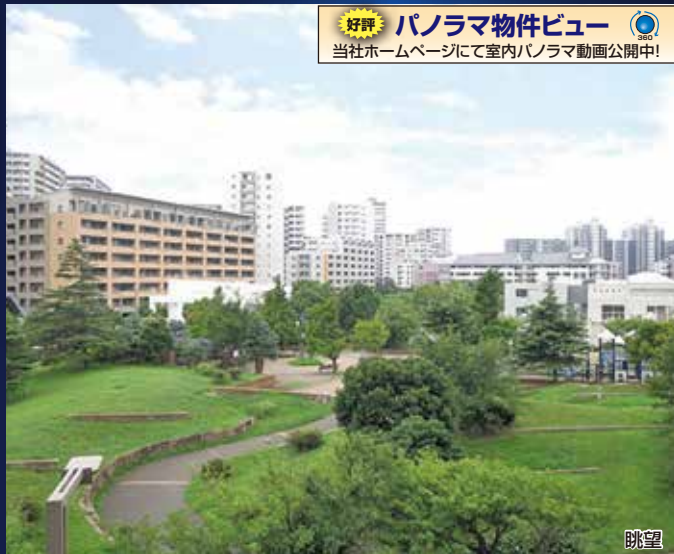
好評 パノラマ物件ビュー 当社ホームページにて室内パノラマ動画公開中!