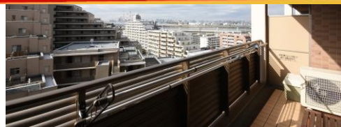
花火大会も楽しめます♪