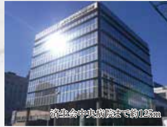
済生会中央病院まで約125m