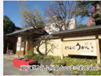
東京芝とうふ屋うかいまで約150m