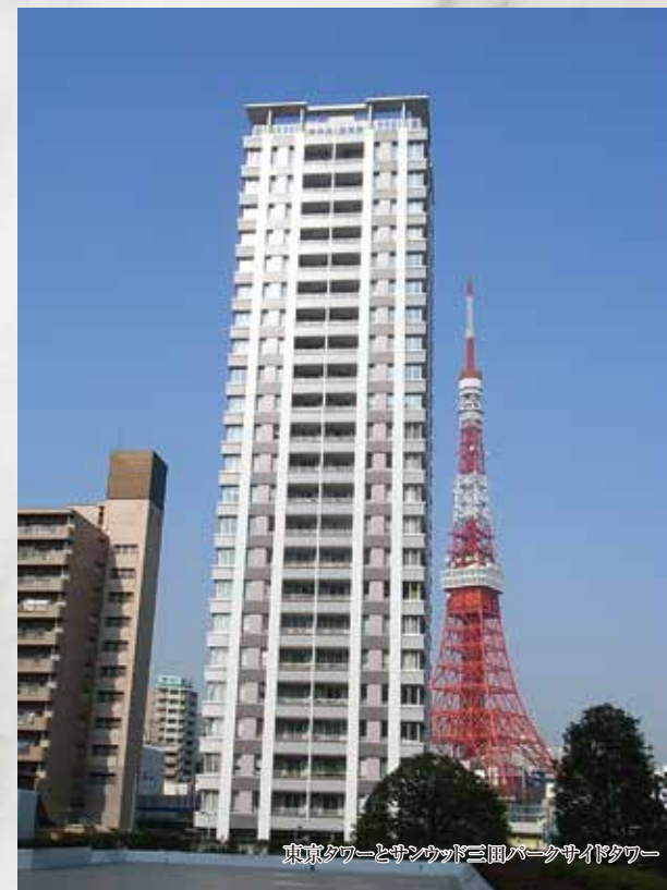
東京タワーとサンウッド三田パークサイドタワー

当該物件リビングから ザ・プリンスパークタワー東京、東京タワー、 虎ノ門ヒルズ、芝公園の緑、増上寺を望む眺望