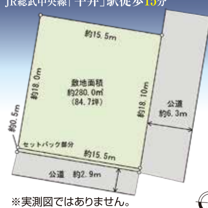
※実測図ではありません。