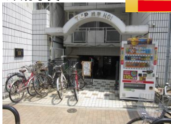
共用エントランス