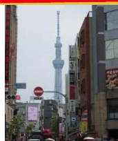
つくばEX「浅草」駅 東京スカイツリー