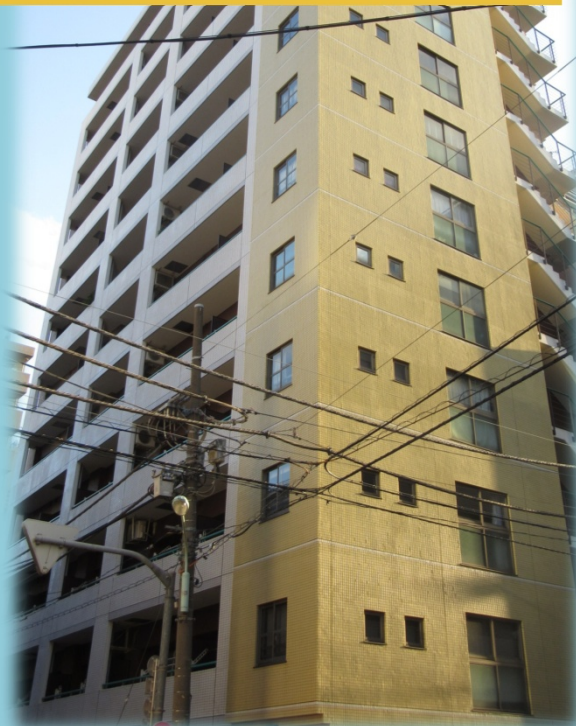
エクセルシオール日本橋