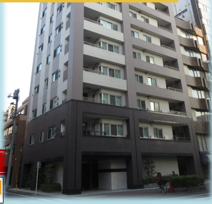
グローバル ザ・シティ蔵前