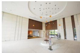
マンションロビー