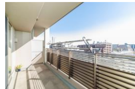
明るいワイドバルコニー