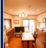
リビングダイニング▲