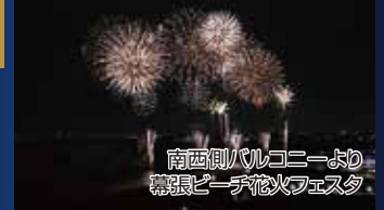
南西側バルコニーより眺望良しビーチ・イルミネーション